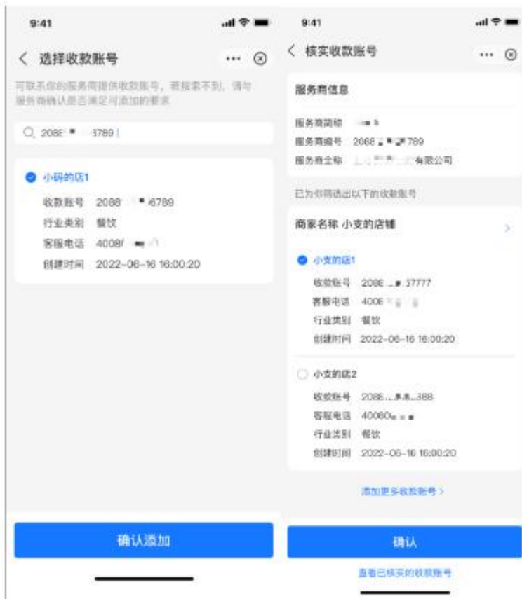
(4) 完成收款账号绑定